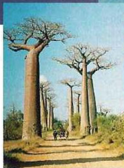
バオバブの並木道